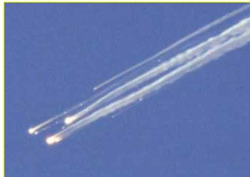
فوریه ۲۰۰۳، اندام شاتل فضایی کلمبیا در هنگام بازگشت