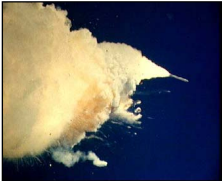
ژانویه ۱۹۸۶، انفجار شاتل فضایی Challenger در لحظه پرتاب