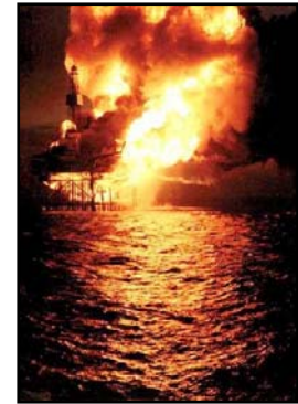
جولای ۱۹۸۸، Piper Alpha، از بین رفتن سکوی نفتی به دلیل آتش سوزی و انفجار