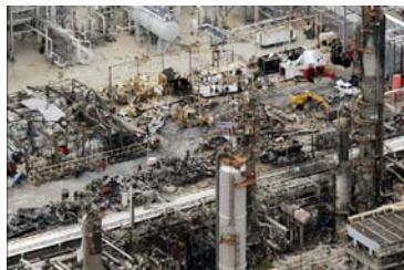
مارس ۲۰۰۵، انفجار پالایشگاه تکزاس

علت بروز این حوادث که تماماً سیستمهای فنی پیچیده داشتند چه بوده است؟ بررسیهای بعمل آمده نشان می دهد که در تمامی آنها مشکلات مربوط به فرهنگ ایمنی بعنوان مهمترین عامل مطرح بوده است. اما "فرهنگ ایمنی" چیست؟ سازمان ایمنی و بهداشت انگلستان "فرهنگ ایمنی" را به شکل زیر تعریف می کند: "... محصول ارزشها، نگرشها، شایستگی ها، هنجارها و الگوهای رفتاری فردی و گروهی است که میزان تعهد و پایبندی به روشها، کارآیی و برنامه های ایمنی و بهداشت سازمان را نشان می دهد."